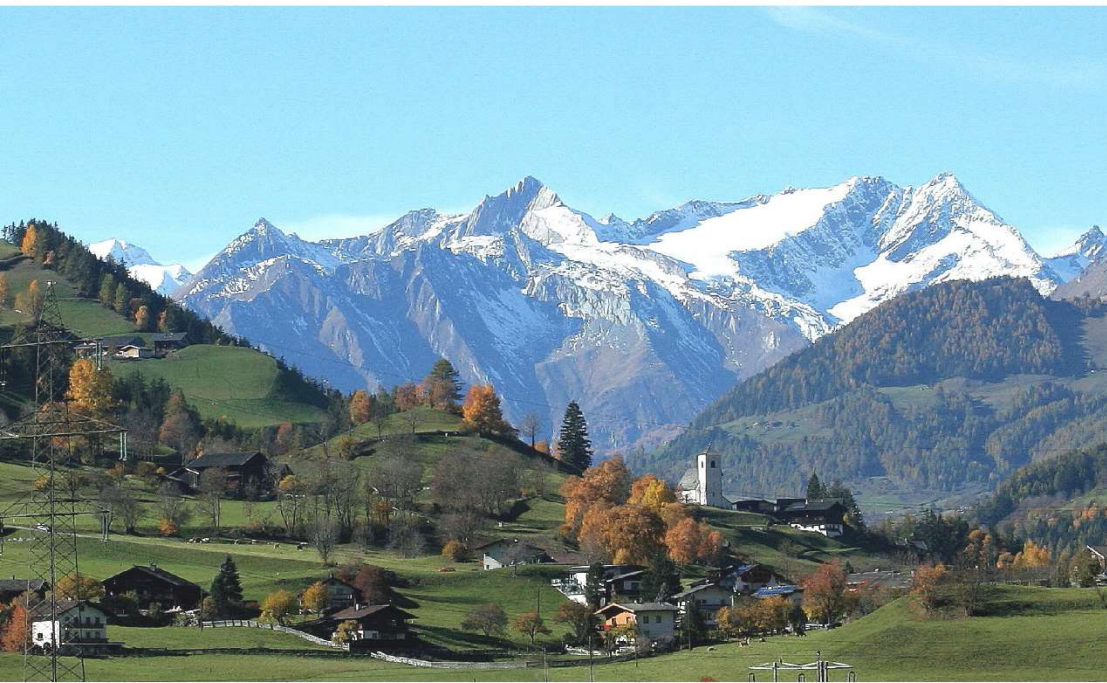
Die fotografischen Präsentationen im regionalen Maßstab sind zugleich Texte, die die Landschaften als Lebensräume kennzeichnen (bei Matrie i. O., Blick ins Virgental).

Strukturanalyse auf der Ebene der Gemeinden: Erwerbsbevölkerung (am Wohnort) nach der dominanten Zugehörigkeit zu Wirtschaftsabschnitten. Gemeindetypisierung, Clusteranalyse, wirtschaftliche Zugehörigkeit in Farbe: rot zu Wirtschaftsdiensten, blau zum Sekundären Sektor, violett zum Kernbereich der Tourismuswirtschaft