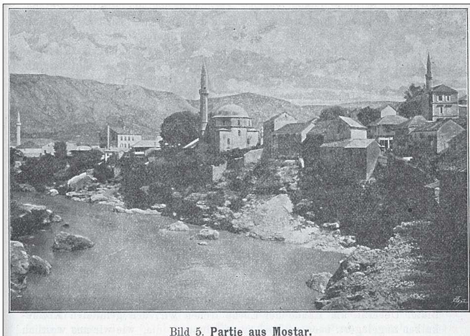
Bild 5. Partie aus Mostar.